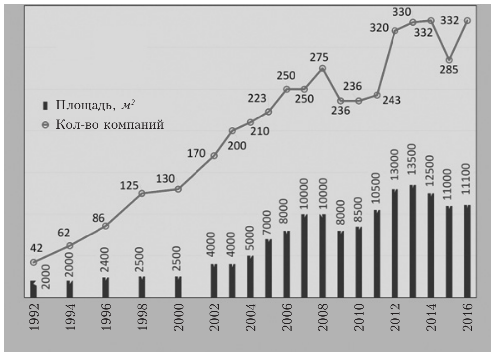
Схема 1. БиОТ - 1992-2016

По данным независимого аудита Российского союза выста-